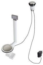
VIDAGE FADE LIGHT A407 A17