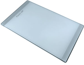
PLANCHE DE DECOUPE CRYSTAL 23x41 CM A631 C00